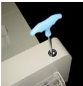
Regolazione discesa lama