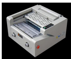
Design Moderno e Funzionale