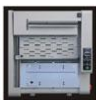
Inserimento della cover comodo scarico libro veloce