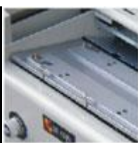
Pressa Regolabile (solo 920V)