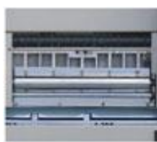
Un solo passaggio sui rulli colla